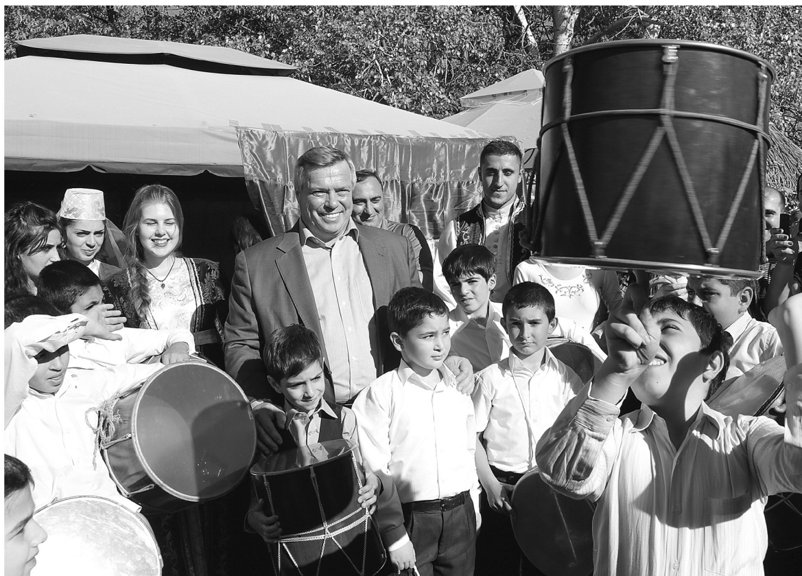
● Праздник «Дон многонациональный» в Усть-Донецком районе

зачастую бытовые. Не национальная неприязнь стала истинным источником агрессии. Причем это общая тенденция, наблюдаемая не только в нашей области – из-за соседских споров могут подраться и русский с русским, и турок с турком, – полагает глава региона, – но поскольку слишком много желающих на этом фоне получить